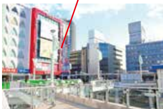
柏駅東口(ペDESTリアンデッキ) ビックカメラ